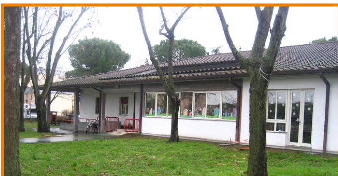
Casa dei Bimbi 1 – Sede Pinarella