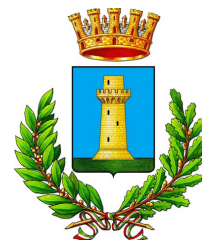
Comune di Russi