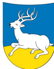
Comune di Cervia