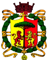
Comune di Ravenna